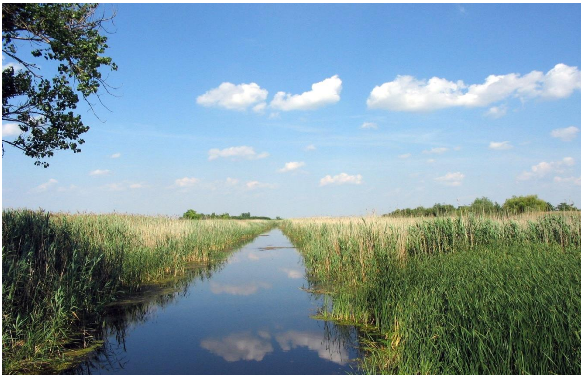
Водоток Јегричка код моста на путу за Бечеј

Водоток Јегричка је дужине 64 km и представља највећу речицу на Бачкој јужној лесној тераси. Некада најдужа аутохтона Војвођанска река, нема класичан извор и представља систем повезаних канала кроз које вода отиче до свог ушћа у реку Тису преко црпне станице Жабалъ (Црна ђуприја).