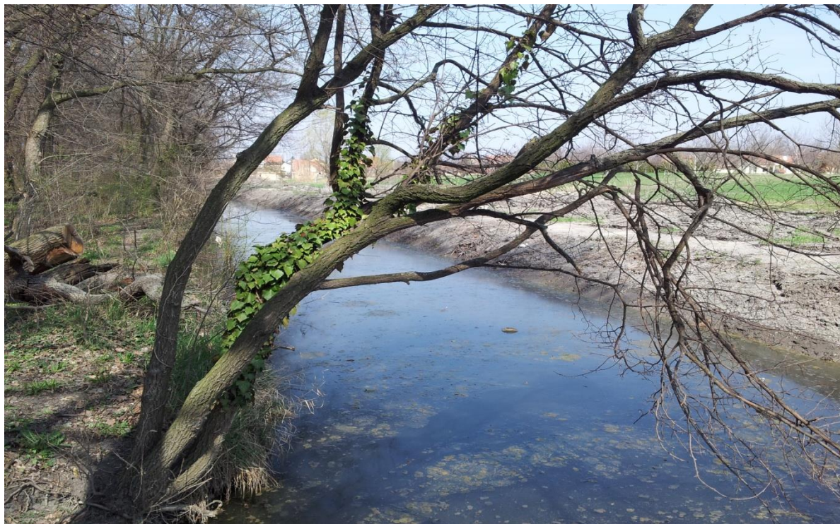
Канал J-152 поред парка у Темерину

Одводњавање терена врши се путем мелиоративних канала вишег и нижег реда, као и тзв. комуналним – атмосферским каналима у насељеним местима. Коначни реципијент за све канале детаљне каналске мреже је канал Јегричка. Целокупно одводњавање свих канала се врши гравитационо, без присуства црпних станица на терену. Најзначајнији мелиорациони канали у систему за одводњавање Темерин су: J-152 стационаже у Општини Темерин од 8+010 до 18+640, J-334 од 0+000 до 12+480 и канал J-362 од 0+000 до 7+500км.